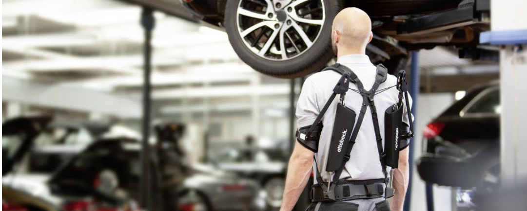
Abbildung 1: Exoskelett Paexo von Ottobock ( https://www.ottobock.com/de/presse/pressemitteilungen/exoskelett-paexo-geht-in-serie.html )

Dieses System soll muskuloskelettale Erkrankungen, die bei der Überkopfarbeit auftreten können, reduzieren oder vermeiden. Es handelt sich dabei um ein passives System, das ohne zusätzliche Energiezufuhr funktioniert. Um Schulter und Arme zu entlasten, leitet das Assistenzsystem die dort wirkenden Kräfte auf die Hüfte um.